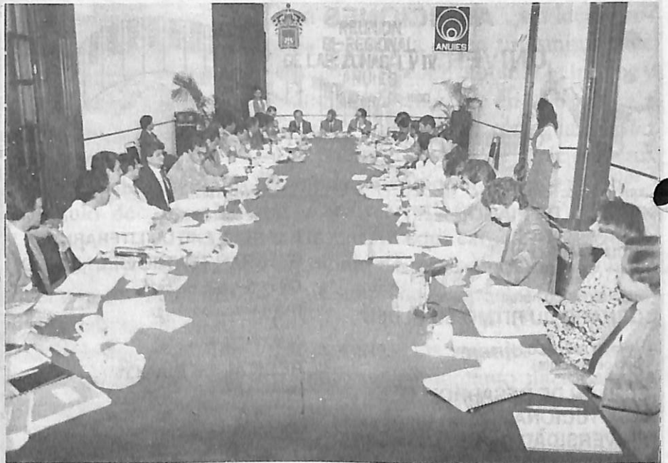
La Universidad de Guadalajara fue Sede de la reunión BI-REGIONAL, de las zonas I y IV de la ANUIES, el 14 de junio.