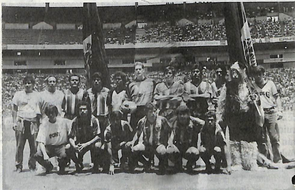
Plantel de los Leones Negros, que obtuvo el Sub-campeonato de Fútbol de primera división en la Liga Mexicana temporada 1989 - 1990