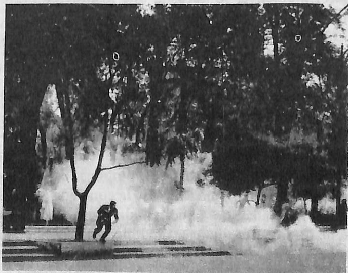
Participación estudiantil en el movimiento vallejoista, México 1958.

Esta universidad nueva debe ser la universidad científica, precisó. Se trata de arribar a una institución que tenga como sustento principal el desarrollo cabal de la investigación científica que genere conocimiento de frontera, a partir de la cual sea posible diseñar perfiles profesionales actualiza-