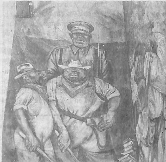
Fragmento del Mural La Masa y los Dogmas en el Paraninfo Universitario

A la parte del mural desarrollada en el foro del Paraninfo, Cardoza y Aragón la llama La masa y los