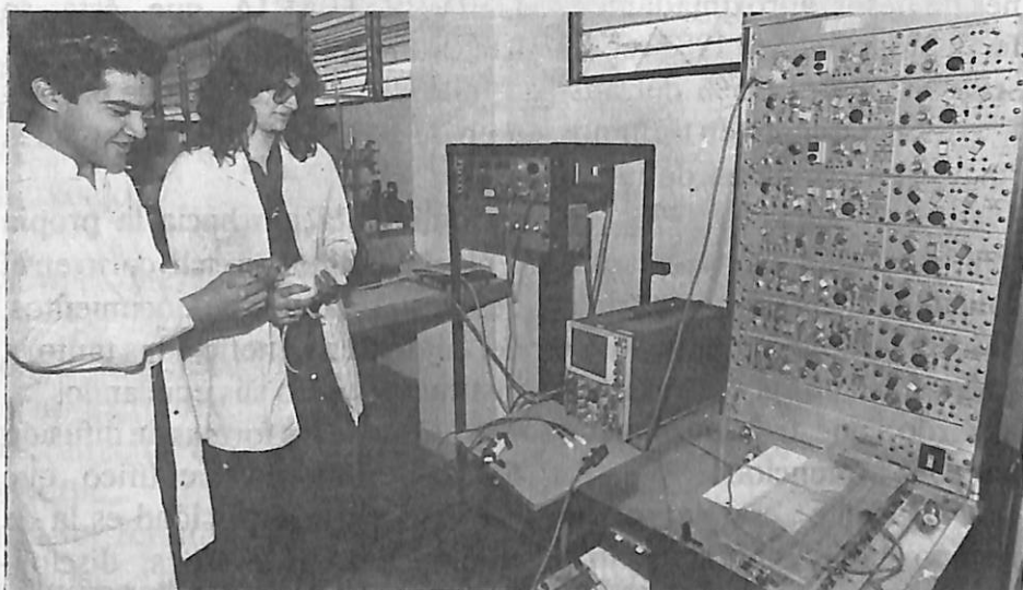
Investigadores en el Laboratorio de la Facultad de Ciencias

Actualmente el subsistema de investigación en la Universidad, lo conforman 59 dependencias entre facultades, escuelas, centros e institutos que