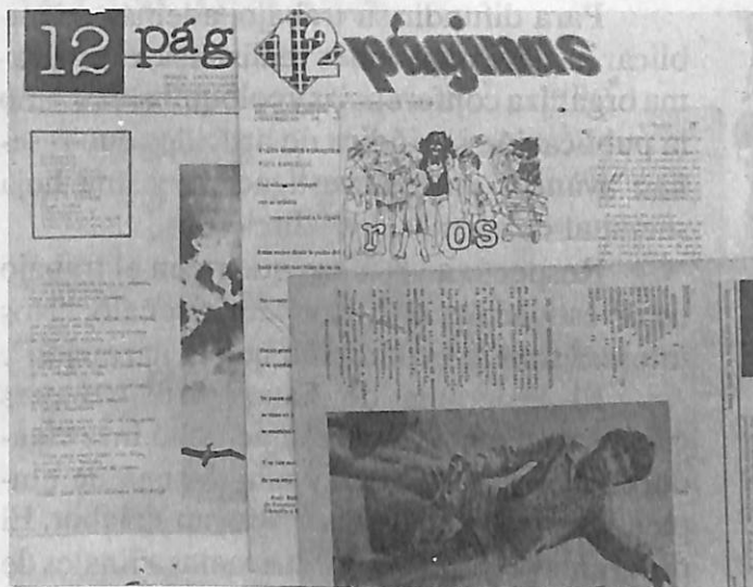
Ejemplares del periódico Doce Páginas

Como producto de su aprendizaje, los alumnos producen el periódico Doce Páginas , publicación que realizan en todo su proceso. También editan plaquetes de trabajos literarios producidos por