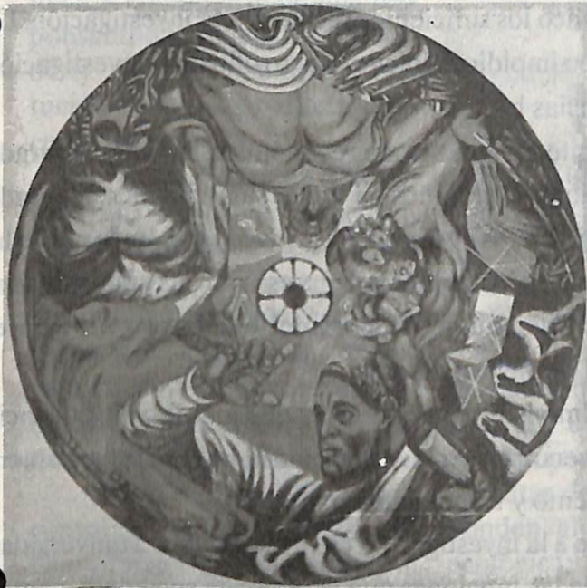
Hombre Polifacético , Mural de Clemente Orozco en el Paraninfo Universitario.

* Promover la cultura científica y académica: DICSA