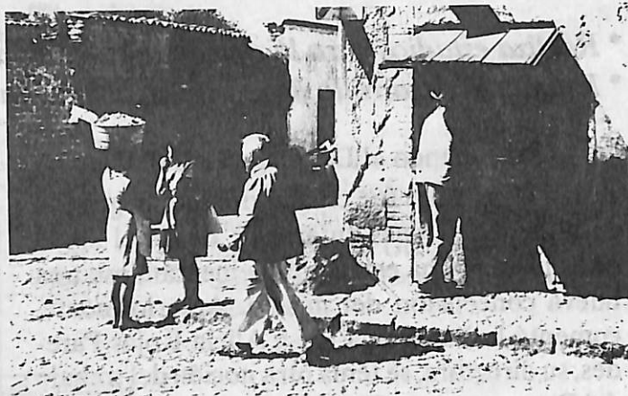
Sin nombre.

"Si bien es real que nuestro proyecto de educación continua ha tomado en cuenta algunos referentes externos en diseño y operación de esta actividad en la Universidad de Guadalajara, es preciso decir que las orientaciones fundamentales de dicho