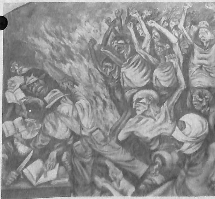
Fragmento del Mural La Masa y los Dogmas en el Paraninfo Universitario

dogmas. Aquí, el artista plasmó a una multitud de hombres desnutridos, de rostros adoloridos, marcados por la desnutrición, que alzan los brazos y gesticulan. Delante de esta multitud se afirma un personaje con atuendo de líder obrero que empuña un serrucho a modo de batuta, para dirigir un coro de forzadas consignas hacia el lugar donde los ideólogos señalan lo que es necesario leer. A la izquierda del foro, Orozco pintó una trinidad de personajes repulsivos, campesinos y obreros armados, que en cierto modo, complementan la escena del tablero central, sobre la ideología y los dogmas, ya que junto a los personajes se levanta una columna de libros al lado de los fusiles y mazos. Al lado derecho del mismo foro, dos hombres y un niño esqueléticos y desnudos, muestran la miseria en que vive el pueblo.