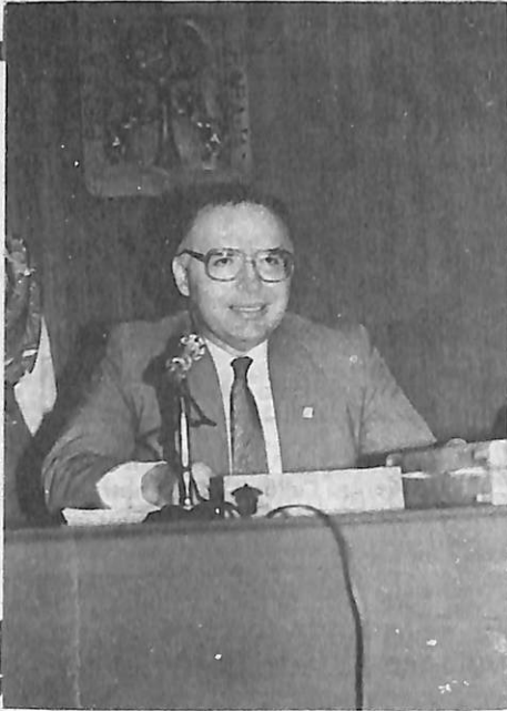
El Dr. Jorge Carpizo McGregor, durante su conferencia: "Principios constitucionales de la justicia social en México", dictada el 1º de junio en el Paraninfo Universitario.