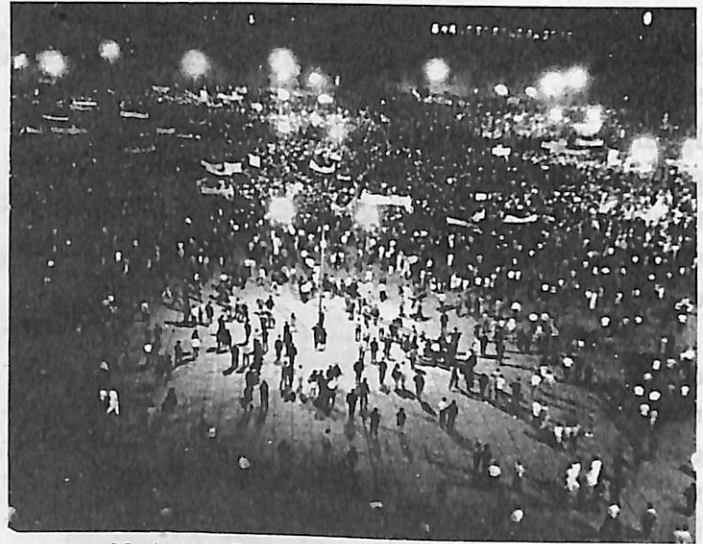
Movimiento Estudiantil en el Zócalo, México, 1968.

Necesitamos, enfatizó, ir más allá del "gran