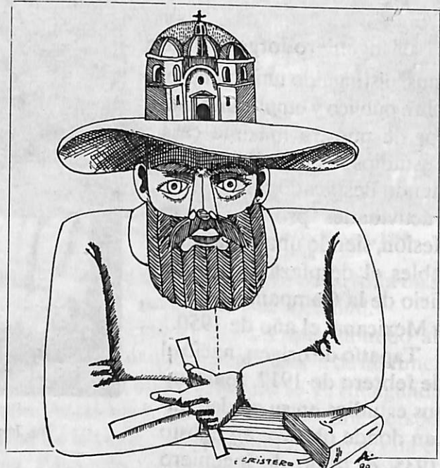
El Cristero, dibujo de Alfredo Larrauri

Entre los temas de investigación que se trabajan, destaca la Historia General de Jalisco, que busca mejorar y ampliar los cuatro tomos publicados en 1982, bajo la dirección del doctor Muriá. Se trabaja también en la investigación de los límites territoriales de Jalisco con Nayarit y Colima; otros temas son la historia de la educación superior en el estado, Lecturas Históricas