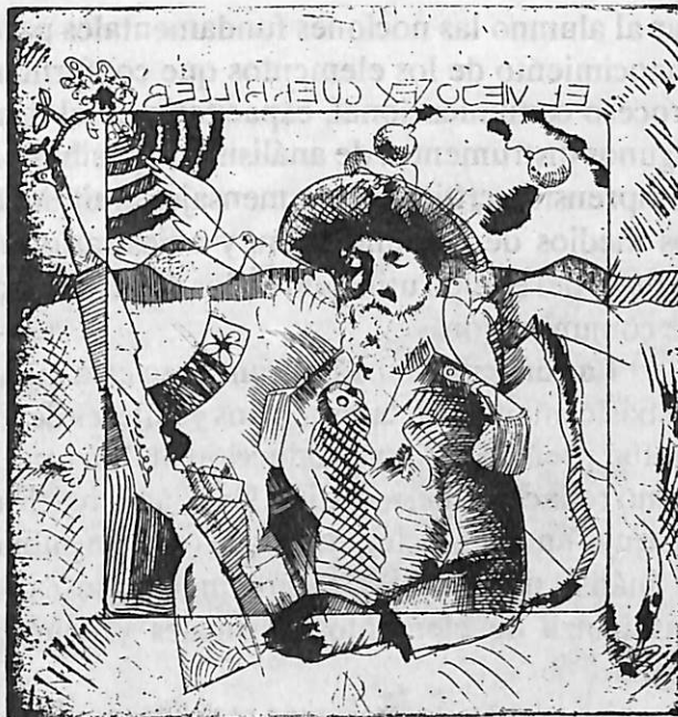
El Viejo Guerrillero, Dibujo de Alfredo Larrauri

Con el apoyo sustancial que se da a este proyecto académico, nuestra Universidad contribuye a mejorar el conocimiento de la historia regional y difundir la cultura jalisciense.