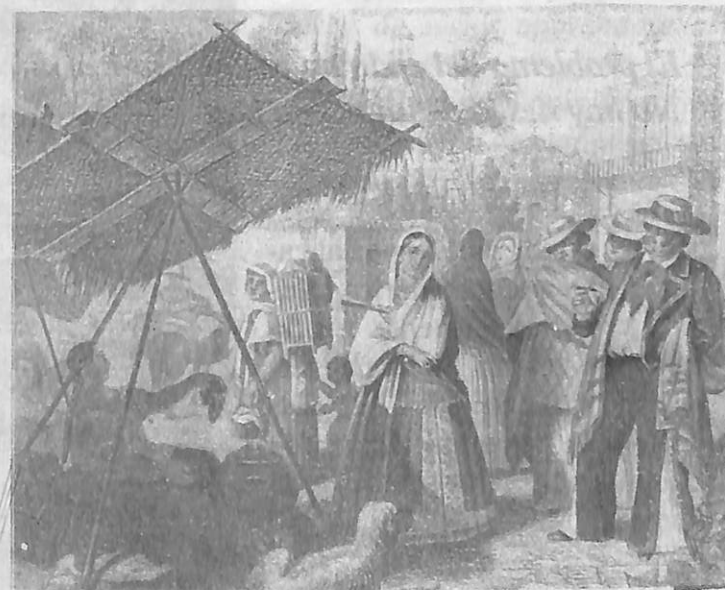
Placeros y Rancheros de M. Rugendas

Con este trabajo, Chevalier inicia un importante camino en torno a la historia agraria de México, el cual, otros destacados investigadores